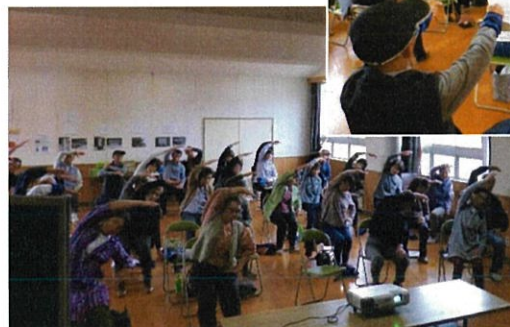
継続的な実施ができたらいいですね！