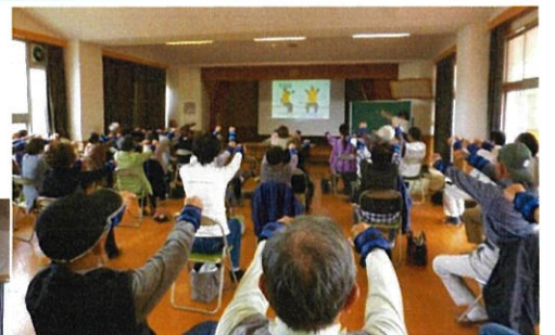
百歳体操で、元気にイキイキと！！